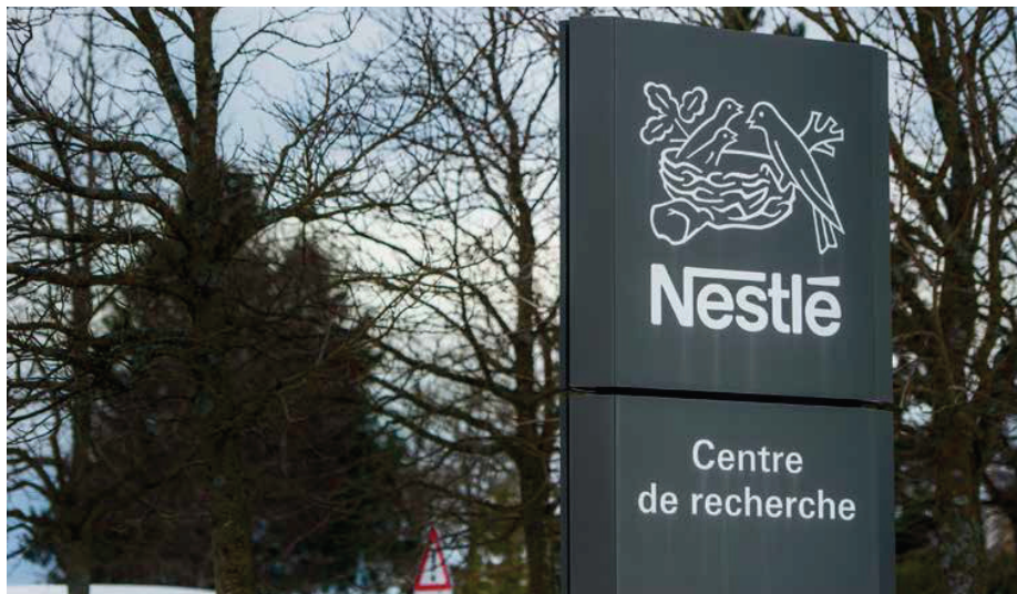
L'entrée du bâtiment du centre de recherche de Nestlé à Vers-chez-les-Blanc (VD).

Autre trompe-l'œil: le volume de brevets déposés. La Suisse y fi-