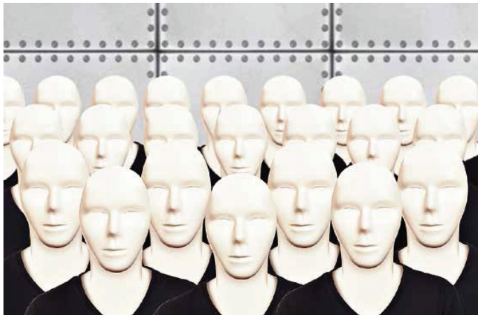
A partir de quand une machine devient-elle un robot? Avant d'envisager de taxer ces derniers, il faudra encore se mettre d'accord sur cette question essentielle.

Ces avancées pourraient toutefois être freinées. Comme pour