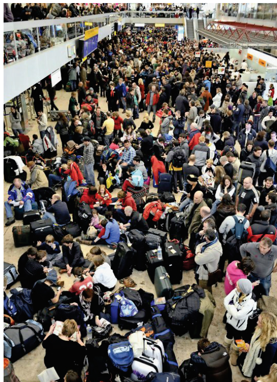
L'aéroport a accueilli 16,5 millions de passagers en 2016.

gnies d'aviation, EasyJet se taille toujours la part du lion, ayant franchi la barre des 7 millions de personnes transportées au bout du lac, soit une hausse de 5,9%. Une telle croissance représente un énorme défi pour Genève Aéroport. Corine Moinat, présidente du conseil d'administration, admet que la plate-forme a accumulé les retards en matière d'infrastructure, mais plusieurs grands chantiers sont en cours. Côté investissements, quelque 162,5 millions de francs ont été mis sur la table l'an dernier. Page 15