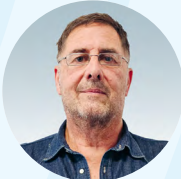
Fabrizio Rossi Graphiste