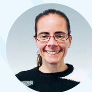
Marilia Leite Documentation, archives