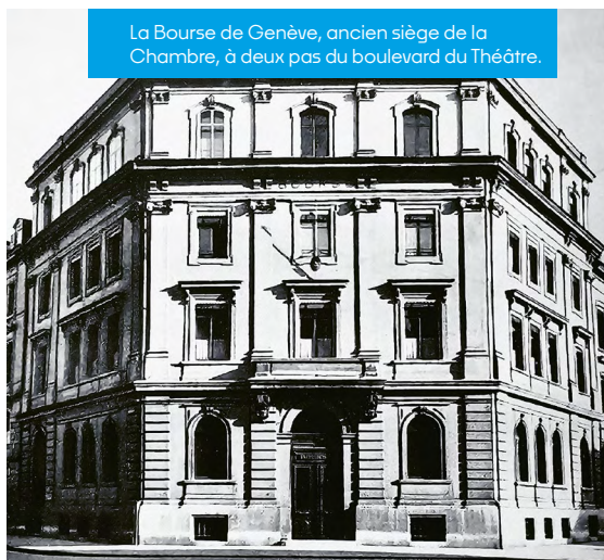
La Bourse de Genève, ancien siège de la Chambre, à deux pas du boulevard du Théâtre.

Grâce à une vision tournée vers le développement économique, la Chambre de commerce de Genève devient un acteur essentiel du tissu genevois. Elle joue un rôle crucial dans la modernisation des infrastructures locales et le soutien aux entreprises pour renforcer leur compétitivité. En dépit des pressions protectionnistes croissantes, celle qui fut brièvement l'ACIG, et qui deviendra la CCIG, reste fidèle à ses principes de libre-échange et contribue activement à faire de Genève un pôle d'attraction pour les entreprises étrangères et les investissements internationaux. La Chambre ne cesse depuis 160 ans de consolider sa position de pilier de l'économie genevoise et d'anticiper les défis du XXI e siècle.