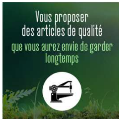
Engagement n.1: choisir la qualité